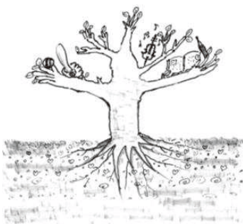
〈幹にかけるのは目〉

木の幹がみるみると成長していくような、小学校の高学年から中学生の時期は、我々大人が戸惑うようなこと、予想外の行動をすることがあります。注意しなくなったり、イライラすることもあるかもしれませんが、まずはその成長をしっかりと見守りましょう。