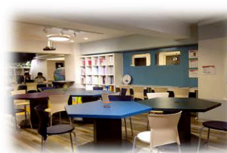
試験前はこの教室が自習生でいっぱいになります!