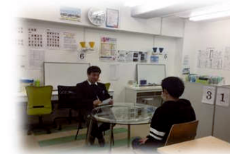
面接練習も行っております。