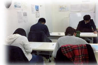
中3生は目標点目指して頑張っています!