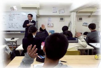
意欲的に授業を受けています!