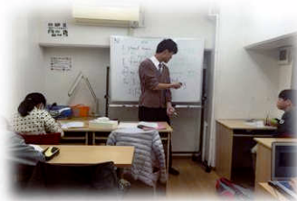
小学生も積極的に質問してくれています。