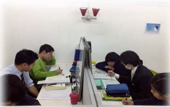
解説を受けたり、演習を繰り返すことで理解を深めます。