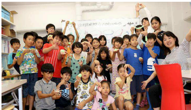
集合写真（恵比寿校）