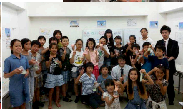
集合写真（世田谷校）