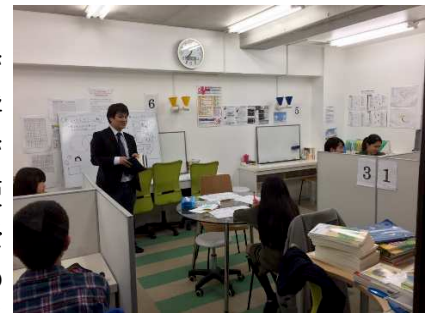
以前のセルフマネジメント講座の様子（世田谷校）