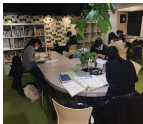
高校3年間で大きく左右するこの時期。しっかりと準備をしましょう！

大学受験で浪人してしまう生徒さんの多くは、この時期に気が抜け、高校最初の試験で失敗し、結果として勉強から遠ざかっていくことが多いのです。あんなに苦労して高校受験したのに、また勉強しなくなってしまっただけはもったいないと思いませんか？Freewillでは、そうならないように以下のような「高校準備講座」を設け、高校最初の試験で80点以上を目指しています！