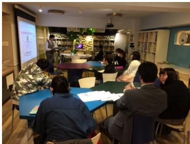
～ガイダンスの様子～

恵比寿2階は、中学生も自習として使うことができ、定期テスト前の平日は多くの生徒さんが利用しています！