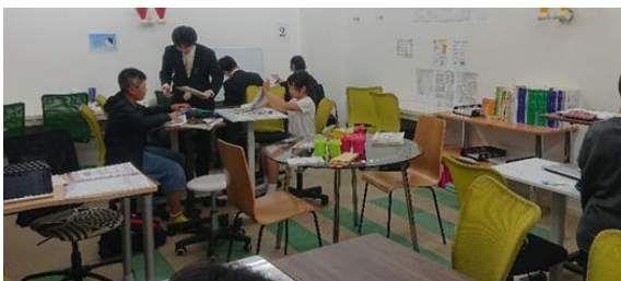
とても一体感のある部屋で、それぞれが勉強に集中しています！