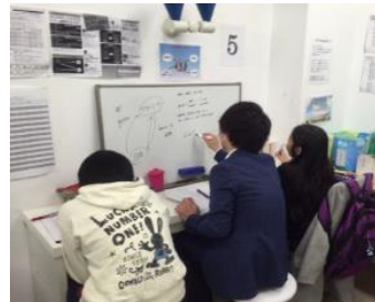
熱心に先生の解説に耳を傾けています！

5月から始まる英語教室に向けて、畳の部屋も只今改装中です。楽しく勉強できるような空間にいたしますのでご期待！