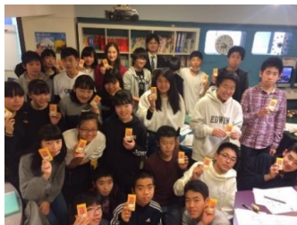
カロリーメイトを持って集合写真！み んな、いい顔してます！