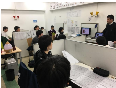
~昨年度の中3ガイダンスの様子~ 自分の内申点をもとに、入試本番で何点取ればいいのかを、一生命計算しています！