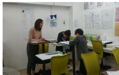
机の高さを調整していますね！