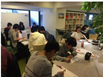
勉強25分、休憩5分のサイクルで、 メリハリをつけて頑張っています！