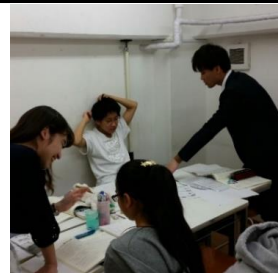
理解できるまで丁寧に伝えます！ ～個別指導の様子～

出身大学：九州大学 芸術工学部 科目：全教科（理系が得意！） 趣味：人と話すこと 目標：志望校合格100%！！ あとは、自分の力でご飯を 食べていける強い人間に なってください！