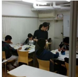
生徒どうして、やる気を高め合います！ ～グループ指導の様子～