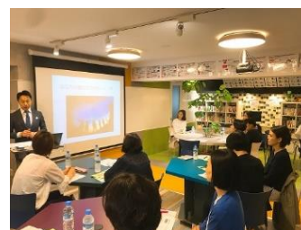
前回の保護者会の様子です。 多くの保護者様のご参加、 ありがとうございました！

中学3年生の高校入試に向けた保護者会を11月10日（土）に開催致します。また、大学受験に向けた保護者会を10月27日（土）に開催致します。お子様が第一志望校に合格するためにお父様やお母様がいつ、何をすればよいかということ、具体的な事例に基づいてご説明致しますので、ご参加をお願い致します。