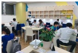
中目黒校の教室の様子です。広々とした空間で授業が行われており、自習に来ている生徒さんもいます！