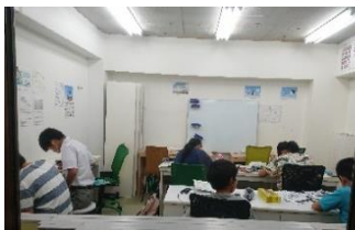
世田谷校の自習の様子です。中学生と高校生が同じ空間で学習に励んでいます！

また、2学期制・3学期制ともに11月に試験があります。今回の試験に向けての計画や取り組みを振り返ってみてください。良かった点や改善点が見えてくると思います。それを次の試験に活かせば、必ず成長できますので実践してみてください！