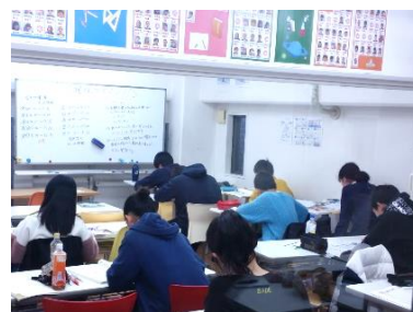
～理社マラソンの様子～

生徒たちの成長を目の当たりにでき、われわれもとても嬉しく感じました。これからもお子様を全力でサポートしていきます。