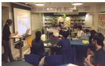
～セルフマネジメント講座～

【セルフマネジメント講座】 将来の夢や目的を意識することは、勉強や部活・習い事等で忙しい日々の活力となります。そこで、将来の夢や目的を再確認し、充実した日々の生活を送ってもらうために年4回「セルフマネジメント講座」を開催しております。