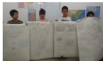
～読書感想文発表会～

【理科実験教室】 学びは、知識をただ詰め込むだけではなく、自ら疑問を持ち、考えて実行するという体験を通してより深められるものです。そのような学習環境作りの一環として「理科実験教室」を年5回、開催しております。理科実験教室では、毎回の実験を通して理科の面白さに触れてもらうという大人気イベントです。