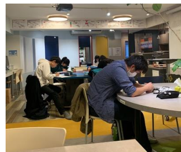
演習後もそれぞれの課題を明確にして、モチベーションを維持できていました。