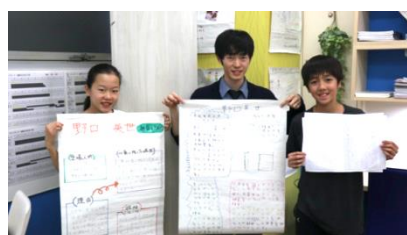
楽しく伝記を読みました！

2019年度最後となる第4回読書感想文は、1～2月に開催予定です。保護者の方には本の購入や図書館で本を借りるお手伝いをお願いできればと思います。詳細は後日お配りするお便りをご覧ください。