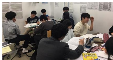
前向きに取り組めていました！