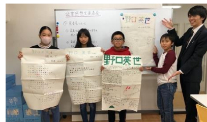
工夫して模造紙を作りました！