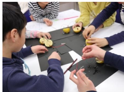
グループのみんなと協力！

次回の理科実験教室は3月に開催予定です。2019年度最後の理科実験教室となりますのでお誘い合わせの上、ぜひ参加していただけたらと思います！詳細は後日改めてお配りいたします。