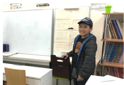
ハキハキと発表できました！

発表会に参加した生徒さんは、緊張した表情も見せていましたが、伝記を読んで何を感じたのか・どこが印象に残ったのかを堂々と発表してくれました。中には、伝記を読んで気になったことをさらに自分で調べて発表してくれた生徒さんもいました！