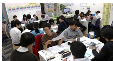
活気に満ち溢れていました！