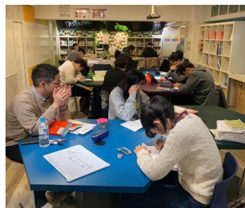
どの生徒も着実に点数を伸ばすことができている。