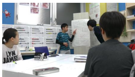
他の人の発表も参考にして…！

さらに、読書感想文発表会を12月18日（水）に恵比寿校・世田谷校・中目黒校の3校舎で開催いたしました。自分の読書感想文をもとに発表用の模造紙を作成し、みんなの前で発表しました。