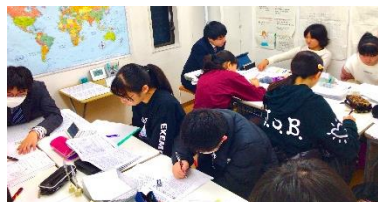
有意義な講習になりました。