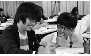
分からないまま終わらせません。疑問解消ですっきり理解と定着を促す学習が大事です。

著書「一流の達成力」 「子にかけない」 受験指導の激戦区渋谷区恵比寿で文武両道のサポートのため独自のメソッドで学習指導を行い、現在400名以上の生徒を指導する。教育をシステム化するような熟練者を擁し、自身も一指導者として生徒指導に当たっている。指導延べ生徒数4000名以上。独自の指導法と教育理念から、メディアからの取材も多い。