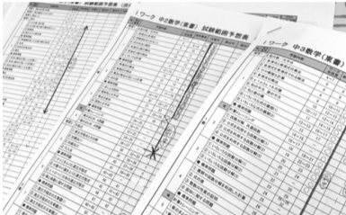
1人1人の目標から逆算し、個々に合わせたカリキュラムを作成しています。日々やることで明確な方向性、学習習慣が身につきます。