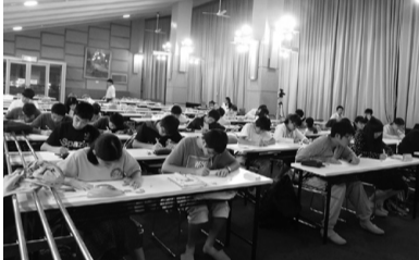
中学3年生の夏合宿。集中力保持の秘訣は「自ら目標を立てること、この姿勢」全員が自立して勉強しています。