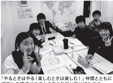
「やるときはやる、楽しむときは楽しむ!」仲間とともに頑張れる環境があるから自ら勉強に取り組みます。