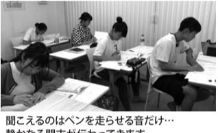
聞かせるのはペンを走らせる音だけ…静かな意志が伝わってきます。